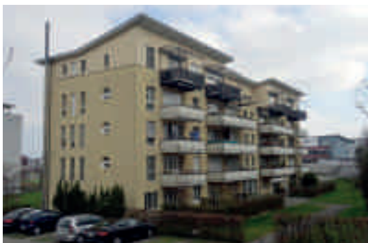
Dreilinden Alterswohnungen, Rotkreuz